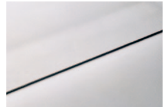
Einfache Verarbeitung von Rhepanol hg mittels Heißluftverschweißung. Eine Nahtversiegelung entfällt!

Für Planer, Landschaftsarchitekten und Verleger erweitert sich mit Rhepanol hg das Terrain, auf dem sie sich die Qualität eines Rhepanol-Markenprodukts zunutze machen können. Diese Lösung passt in die Zeit. Immer größer ist heute die Bereitschaft von Bauherren, Investoren und Hauseigentümern, Dachflächen zu begrünen. Neben ästhetischen und ökologischen Vorteilen liefert das Gründach hauptsächlich auch unter wirtschaftlichen Gesichtspunkten eine überzeugende Vorstellung. Kein Geheimnis mehr, sondern allgemeiner Wissensstand ist die Langlebigkeit einer bepflanzten Bedachung durch Schutz vor UV-Strahlung, Temperaturdifferenzen, Hagelschlag und Krustenbildung.