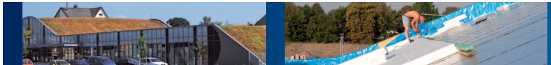
Harmonie pur: Rhepanol hg schützt Penny-Markt in Werne an der Lippe.